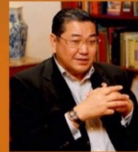
ผ.พิเศษ ดร.สุรเกียรติ์ เสถียรไทย